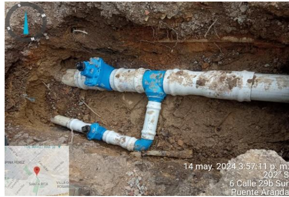
DESPUES: Renovación tubería material PVC – Zanja abierta