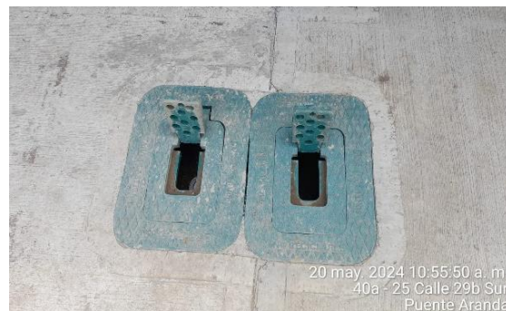
DESPUES: Cajillas plásticas de seguridad

Se ha recuperado el espacio público intervenido durante el proceso constructivo, observándose mejores condiciones a las encontradas inicialmente en el sector: