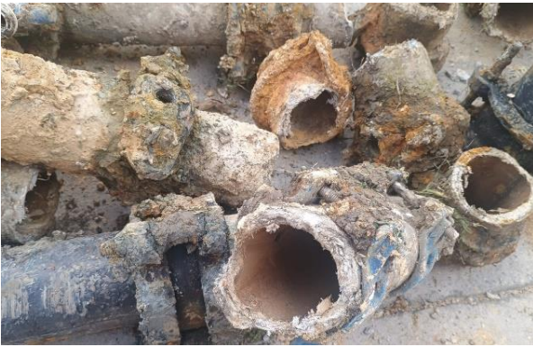
ANTES: Tubería de asbesto cemento