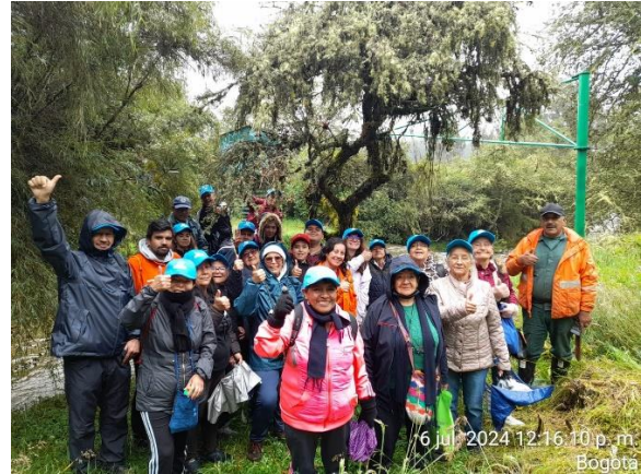
Salida Pedagógica – Predio la Regadera

El contratista dispone de un punto de atención al ciudadano, ACUAPUNTO: