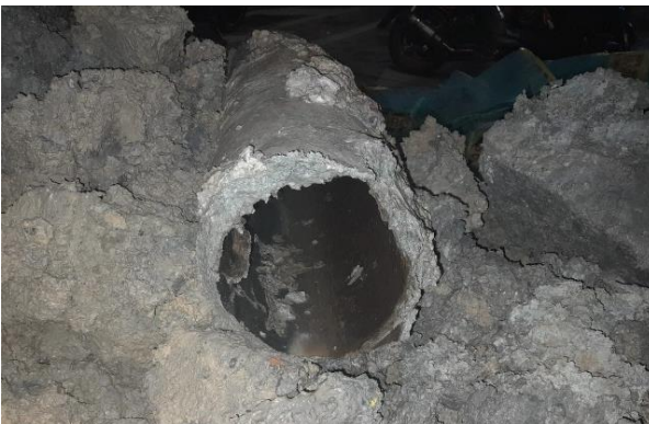
ANTES: Tubería de hierro galvanizado