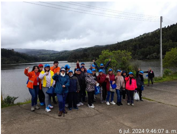
6 jul. 2024 9:46:07 a. m.