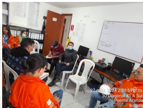
Reuniones con comunidad

27 may. 2024 2:39:59 p. m. 30 Diagonal 41 A Sur Puente Aranda Bogotá