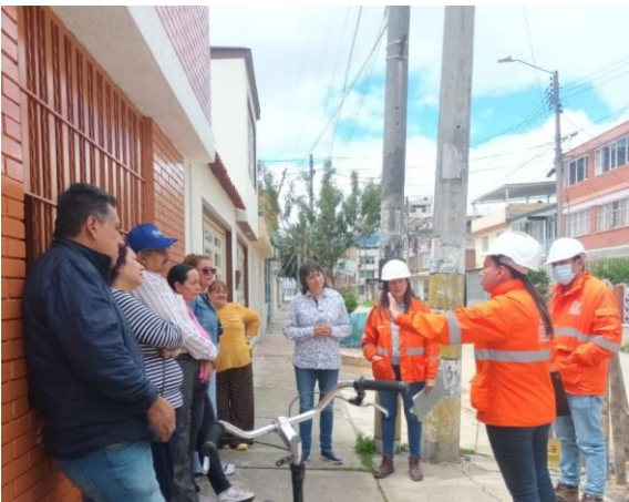
Recorridos con el Comité de veeduría