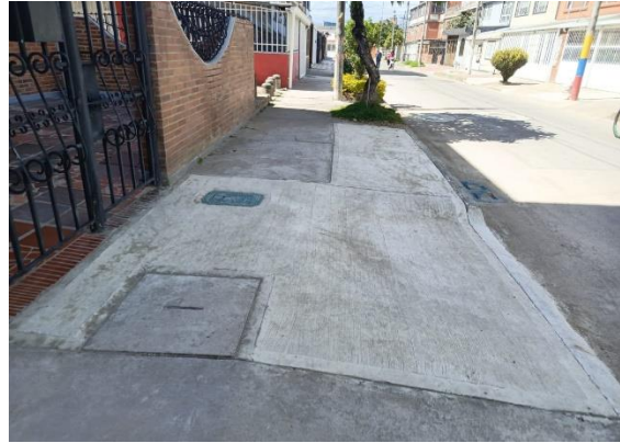
Recuperación área de andén intervenida

De manera constante el área social del proyecto ha articulado acciones para informar oportunamente a la comunidad los procesos: