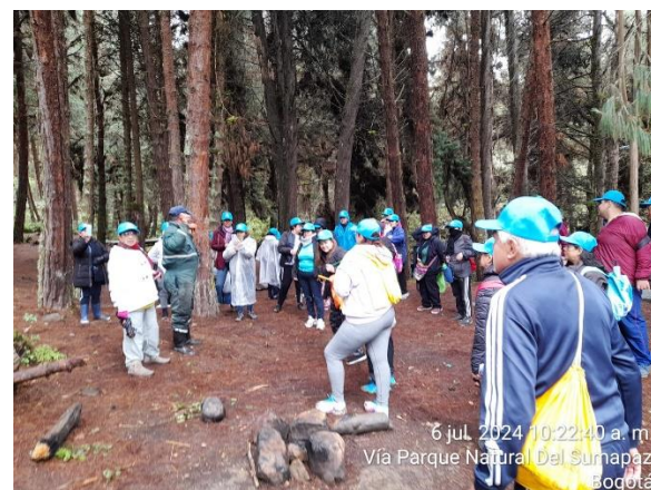
6 jul. 2024 10:22:40 a. m. Vía Parque Natural Del Sumapaz Bogotá