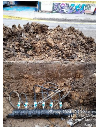
DESPUES: Acometidas a nueva tubería de Polietileno – Pipe bursting