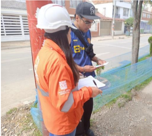
Entrega de piezas informativas