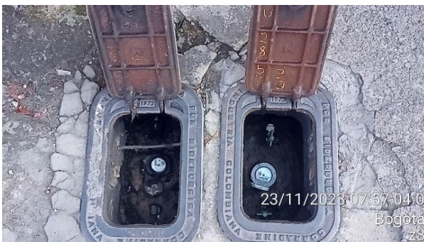
ANTES: Cajillas metálicas